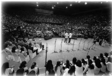
T.B. Joshua en Yakarta, 2007

La Cruzada en Indonesia con el Profeta T.B. Joshua tuvo lugar en Yakarta y Surabaya a finales de septiembre de 2007.