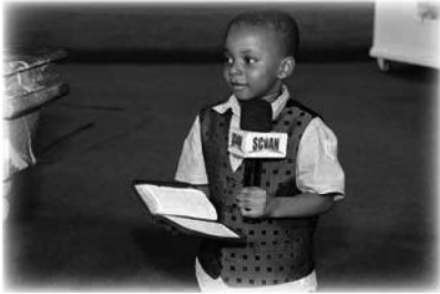
Un niño imita la predicación de T.B. Joshua en 2011

El niño había memorizado una secuencia de Emmanuel TV, citando complejas escrituras y también puntos de enseñanza, como: «El conocimiento significa explicar el desarrollo y la correlación de los hechos del Evangelio», y «¡La profecía no es necesariamente predecir acontecimientos, sino predicar y enseñar la Palabra con poder!».