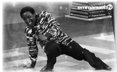
T.B. Joshua baila durante un tiempo de alabanza

¿Qué mostraba la cámara? Un plano por debajo de la rodilla de unos pies girando al ritmo de un vigoroso zapateo. ¿Quién era la persona? Ahora podíamos ver; era T.B. Joshua bailando, mientras alrededor se arremolinaba la alegre resonancia de instrumentos, tambores africanos y voces. Era el servicio dominical en vivo, todo el mundo estaba disfrutando de la oportunidad de alabar a Dios con un poco de ritmo genuino de África Occidental y ninguno más que el pastor.