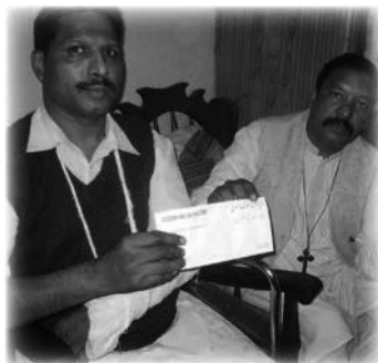
Beneficiarios del apoyo financiero dado por T.B. Joshua para la iglesia en Peshawar