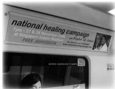
Anuncio en el metro de Singapur para la campaña nacional de sanidad

al otro lado de esta situación, el Profeta T.B. Joshua se encontraba a punto de salir de su alojamiento «a tiempo», cuando, con la mano en la puerta para salir, el Espíritu Santo le habló a su corazón para que esperara.