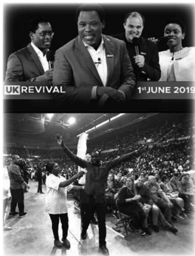
Avivamiento en Reino Unido, Sheffield, 2019

Hubo eventos para varios miles de personas en el Reino Unido, Francia y Argentina en 2018, todos transmitidos en vivo, donde los evangelistas enviados por T.B. Joshua ofrecieron oración con el Agua de Unción en el poderoso nombre de Jesucristo. Se produjeron abundantes sanidades y liberaciones.