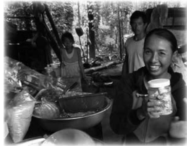
PSuministro de alimentos locales y suministros esenciales a las víctimas de las inundaciones en Laos

El mensaje perdurable de T.B. Joshua sobre las donaciones benéficas es que deben ser de espíritu libre. La labor benéfica de Emmanuel TV en todo el mundo se haría sin «condiciones», es decir, sin exigir ninguna respuesta particular de los beneficiarios o de las