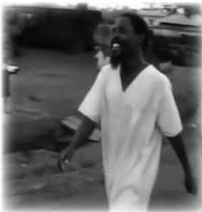
T.B. Joshua caminando en 1989

Como muestra el video documental Esta es mi historia , el medio de transporte de T.B. Joshua en esos primeros años era caminar a todas partes. Dondequiera que fuera, los niños lo seguían. Esos niños y sus madres formarían parte de los primeros miembros de la iglesia.