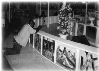
Altar de La SCOAN en 2001

La zona del altar era el sitio donde la gente iba a orar, era culturalmente diferente de las modernas iglesias Protestantes Occidentales con las que estaba más familiarizado, donde el énfasis suele estar en el espacio de adoración.