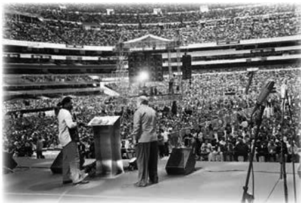
Cruzada en México con T.B. Joshua, 2015

Tuvimos el privilegio de unirnos a un equipo que se dirigía a Sudáfrica para conocer a quienes habían perdido a sus familiares en este ataque. Eran personas de fe, humildes y preparadas para asumir las cosas difíciles de la vida con fe. El amor que se encendió en los corazones de la gente por el ministerio fue asombroso, espiritual, del Cielo. La historia revelará lo que se derivará de las vidas de estos mártires, personas que encontraron una muerte inesperada en pos de Dios. Ellos y sus familias han dado un ejemplo, un estándar de comportamiento que solamente podemos esperar imitar. Muchas familias seguirán siendo apoyadas por el ministerio a través de la educación.