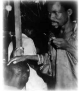
T.B. Joshua tras su regreso del ayuno de 40 días

Dios mismo derrama la unción divina en todos los que tienen el maravilloso privilegio de convertirse en Sus hijos (2 Corintios 1:21-23 y Lucas 24:48-49). 6