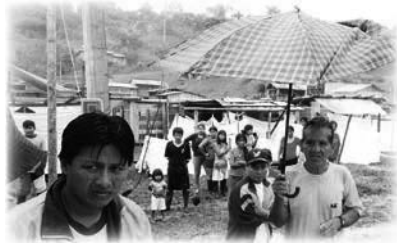
San Salvador después del terremoto

por el gobierno como también algún tipo de apoyo para la comunidad Chachi. Los alimentos y la ayuda higiénica debían obtenerse en Colombia, donde algunas iglesias se habían ofrecido para ayudar a Emmanuel TV, por este motivo había que dirigirse hacia Bogotá para solicitar los alimentos y organizar el transporte.