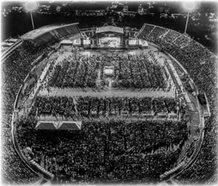
Cruzada en la República Dominicana con T.B. Joshua, 2017

del equipo técnico, llegamos temprano y pudimos ver esto en acción. Los coros que ensayaban sonaban celestiales, y en todas partes se respiraba esa voluntad. Un cálido espíritu de equipo, más allá de las culturas, los colores y los orígenes, era evidente en los creyentes locales. La preocupación era suponer que toda la gente que quería ir no cabría en el estadio con capacidad para 40.000 personas. De hecho, muchos tuvieron que escuchar desde el parque exterior.