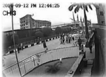
Imágenes de CCTV que muestran el derrumbe de todo el edificio de forma simétrica

El momento real del derrumbe del edificio fue captado por las cámaras de seguridad de CCTV, mostrando que todo el edificio se derrumbó sobre sí mismo de forma simétrica y completa en poco menos de 4 segundos, sin afectar a los edificios adyacentes.