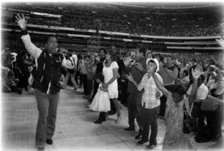
Oración Masiva en México

La cruzada y la gran Conferencia de Pastores que le siguió tuvieron un impacto tremendo. Un equipo de La SCOAN se quedó durante varias semanas para grabar los testimonios de seguimiento y editar la gran cantidad de material de video. Incluso nos trasladamos personalmente a vivir a México durante más de un año para ayudar en el seguimiento, especialmente en el trabajo de caridad. T.B. Joshua ayudó a crear una asociación civil local de apoyo para la ejecución de estos cometidos.