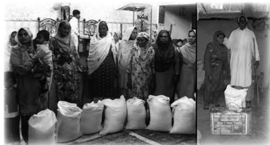
Viudas de Pakistán reciben sacos de harina y máquinas de coser de regalo