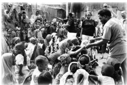
T.B. Joshua visitando a los necesitados en 2007

La Biblia dice: «Velad y orad...», lo que significa que hay que mirar alrededor antes de orar. Si hay personas que necesitan tu ayuda, haz lo que puedas para socorrerlas: ámalas. Después de esto,