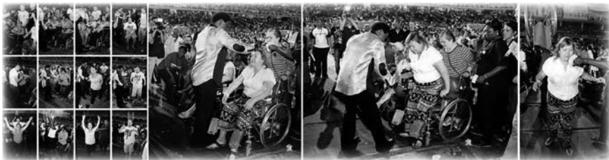
Sanidades en la línea de oración en Cali, Colombia

Hubo decenas de sanidades y cientos de liberaciones, y el nombre de Jesús fue levantado en alto. El difunto evangelista C.S. Upthegrove, que había trabajado con muchos de los evangelistas de sanidad más destacados de Estados Unidos en la década de 1950, asistió a la cruzada, con una edad que rondaba los 80 años. Se mostró emocionado por haber visto a