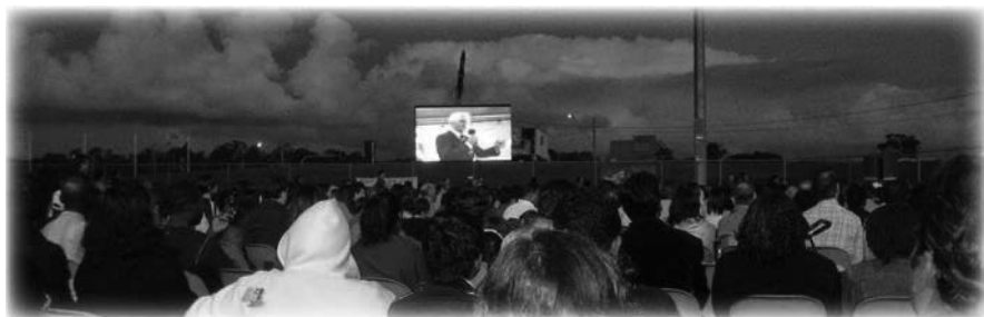
Diputado recibe a los visitantes de la Cruzada Australia para Cristo con T.B. Joshua en 2006

La cruzada «Australia para Cristo» fue un evento al aire libre celebrado en el Parque Deportivo Internacional de Blacktown, en Sidney, los días