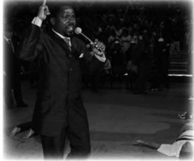
Oración Masiva en Singapur

evangelístico explicando que la única solución permanente a nuestros problemas estaba en el perdón de los pecados mediante la fe en Cristo. Luego prescindió del programa «normal» y pasó directamente a un tiempo de «Oración Masiva», inicialmente para la liberación de los espíritus malignos y luego para la sanidad. Se relató sobre este acontecimiento cuando vimos «los Evangelios en acción» al principio de la escritura de este libro. Mientras todo el estadio repetía el nombre de Jesús al unísono, la autoridad y el poder de Dios eran sobrecogedores. No lo habíamos presenciado antes, ni siquiera en los servicios de La SCOAN en Lagos. Como se ha mencionado anterior-