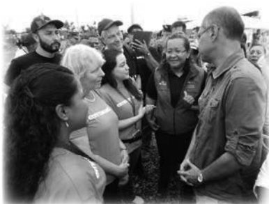
El equipo se reúne con el vicepresidente de Ecuador

era una labor substancial de hacer incluso si se trataba de una visita de una hora a San Salvador. El arquitecto finalizó el plan integral de la escuela y lo presentamos al Departamento de Educación del Gobierno justo a tiempo antes de que se cerrara el plazo de dos meses para auxilios de emergencia. El Gobierno solo autorizaba la ayuda externa para un proyecto de este tipo en estado de emergencia. El plan fue aprobado, pero luego hubo retrasos burocráticos a nivel local que podrían haber amenazado todo el proyecto. Sin embargo, una vez más, experimentamos la provisión de Dios. Un «encuentro casual» con el entonces vicepresidente de la nación (Jorge Glas) ayudó a despejar el camino, y el proyecto siguió adelante para gran beneficio de la comunidad indígena Chachi y para los 300 alumnos de la escuela.