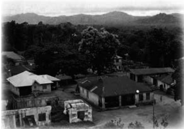
Aridigi en el Estado de Ondo, Nigeria

Un siglo atrás, en una comunidad rural llamada Aridigi, en el estado de Ondo, se hablaba de una profecía inusual. Balogun Okoorun, un guerrero y agricultor, profetizó que de esa rústica comunidad surgiría un hombre poderoso, famoso y con grandes seguidores.