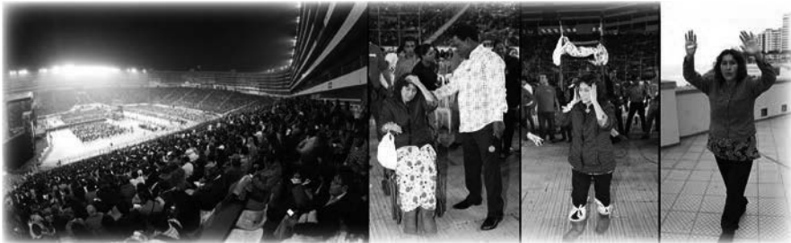
Cruzada en el Estadio Monumental, Lima, Perú

La característica más memorable para nosotros fue la sincronización en el tiempo al límite. Hubo un retraso administrativo con los visados para el equipo de Emmanuel TV que venía de Lagos. Desde el punto de vista de la planificación logística, las decisiones para confirmar la cruzada se dejaron para el último momento posible. Pero esos plazos «finales» pasaron sin que se resolvieran definitivamente los retrasos de los visados, y solamente Dios pudo permitir que la cruzada siguiera adelante. El evento se confirmó apenas dos semanas antes de la fecha