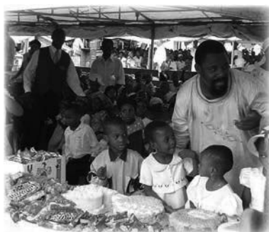
T.B. Joshua celebra un cumpleaños de la escuela dominical en 2002

Era la hora de la oración en el servicio en vivo, y un niño pequeño con