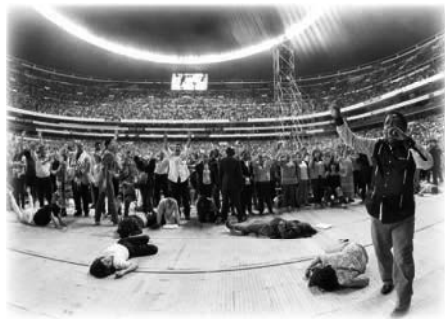
Cruzada en México con T.B. Joshua

Las personas asistían sin distinción de clases sociales de manera gratuita, los milagros se repetían una y otra vez. En el evento realizado en el estadio de fútbol más grande de América Latina, en medio de sus altos y empinados laterales; dondequiera que se mirara, había personas que experimentaban milagros instantáneos mientras la oración resonaba por todo el estadio. Al presenciar la obra sobrenatural de Dios y el efecto de la «oración masiva», la gente aclamaba espontáneamente ¡Cristo Vive!