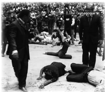
Oración Masiva en Singapur

La gente de todo el auditorio comenzó a reaccionar cuando se pronunció la oración de autoridad. Los oprimidos por los espíritus negativos y satánicos no podían resistir; la oscuridad en su interior estaba