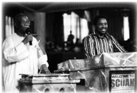
Presidente Atta Mills de Ghana en La SCOAN el 11 de enero de 2009

Más tarde, el 11 de enero de 2009, se celebraría un servicio dominical al que asistiría personalmente el presidente Atta Mills apenas cuatro días después de su investidura como presidente de Ghana. Aquí, él daría las gracias públicamente a Dios por el privilegio de estar en el puesto que ahora ocupaba y honraría a T.B. Joshua tanto como amigo y mentor como Profeta de Dios Todopoderoso. He aquí un extracto de lo que le oímos decir ese día: