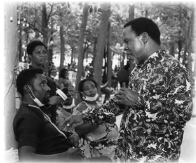
T.B. Joshua ora por los socios de Emmanuel TV en el Jardín

A medida que pasaba el tiempo, T.B. Joshua ministraba oración a los socios de Emmanuel TV desde la Montaña de Oración. Caminando entre los árboles del jardín, un entorno selvático, se