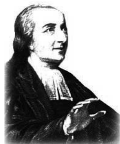
Rev. John W. Fletcher (1729-1785)

John Fletcher, un estrecho colaborador de John Wesley en el siglo XVIII en Inglaterra, se enfrentaba a una deriva similar en la «religión» cuando escribió, con su habitual candor: