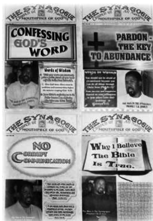
Notas de sermón «Portavoz de Dios» de 2003

Parecía que todos los que querían buscar primero el Reino de Dios y Su justicia devoraban la enseñanza bíblica de T.B. Joshua, apreciando