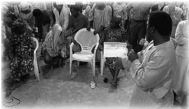
Bebé nace instantáneamente en la línea de oración

Al instante, sintió que agua fluía entre sus piernas; comenzó el proceso de parto y empezó a quitarse la falda instintivamente.