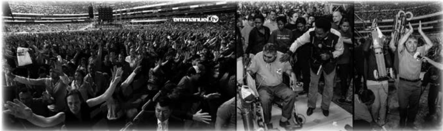
Cruzada de Milagros en México con el Profeta T.B. Joshua, 2015

Antes del evento, el equipo, incluidos los camarógrafos, se sentaron en los asientos más altos para una reunión de planificación; no pudimos evitar sentir algunas «punzadas» de ansiedad. Estaba tan alto, ¿qué pasaría durante la oración cuando la gente reaccionara? «Dios está con nosotros», nos animamos, «Él nos protegerá», y así fue.