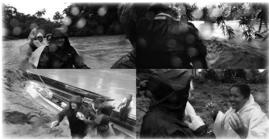
Primer viaje en canoa a San Salvador de los Chachis

Al día siguiente, sentados en un vehículo sencillo, condujimos durante muchas horas a través de pueblos modestos. Íbamos vestidos para una elegante reunión de oficina con un calzado inadecuado para el «monte» y no estábamos en absoluto preparados para lo que nos esperaba. Al salir de la carretera, nos adentramos en una pista por donde avanzábamos con el coche a los tropezones. Nos bajamos del coche junto al río y entramos en una canoa rústica. Sentados en la canoa continuamos el viaje fluvial bajo una lluvia torrencial durante unas dos horas. La canoa estuvo a punto de hundirse, o eso es lo que parecía. Las largas y frondosas ramas de los gigantes árboles se doblaban cerca del río y había remolinos de agua. Nos preguntamos con cierta inquietud si habría cocodrilos. Pero en algún lugar de la mente de Fiona surgía una increíble euforia: