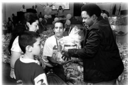
T.B. Joshua en el evento de caridad en Cali, Colombia

Entre los eventos adicionales en Cali, una ciudad que sabía lo que era experimentar la violencia, había una importante actividad benéfica. Se invitó a varios centenares de familias, a las que se les proporcionó el transporte, para que recibieran comida caliente y entretenimiento, una revisión médica profesional para los niños y una gran bolsa de alimentos.