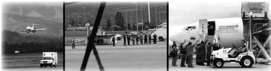
Llegada del avión de carga con la ayuda de Emmanuel TV a Quito