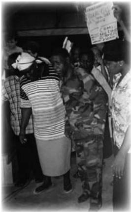
Soldado que recibe sanidad en La SCOAN