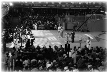
Servicio dominica de La SCOAN en 2009

Algunos visitantes que entraron en el recinto de La SCOAN, respiraron hondo y supieron en su corazón que habían llegado a la arena de la libertad. Ese tipo de fe recibía de Dios. No importaba mucho si la persona se colocaba en alguna línea de oración, si se quedaba en el alojamiento de la iglesia o en un hotel local cercano, si alguien le imponía las manos en oración o no, si sus seres queridos necesitados estaban presentes con ellos o si solo habían traído sus fotos, no era