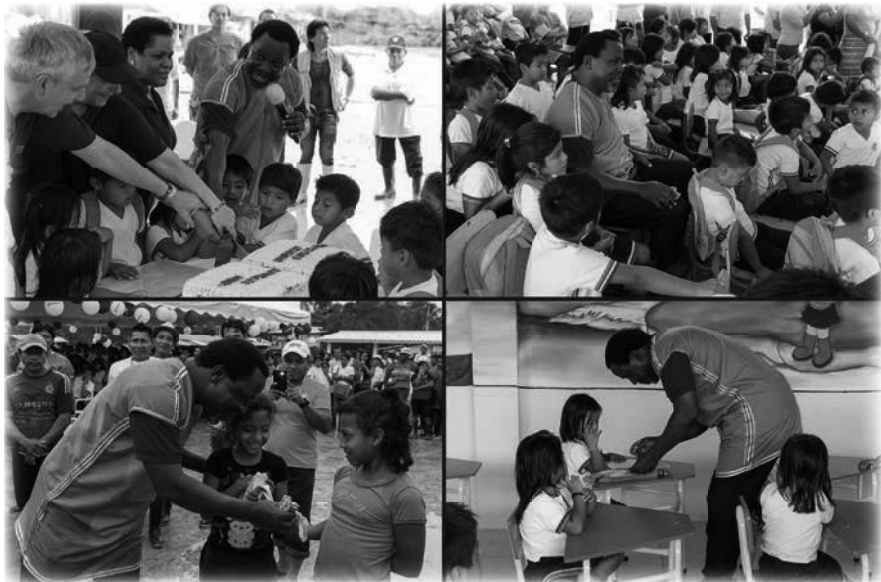
Inauguración de la nueva escuela en Ecuador en 2017

En la mañana de la ceremonia de inauguración de la escuela, formamos parte de un equipo de avanzada que apenas logró hacer todo el recorrido hasta la escuela en un vehículo 4x4. Como resultado del proyecto, el Gobierno había ensanchado el camino junto al río hasta San Salvador, y en los pocos días que estaba lo suficientemente seco, el trayecto podía completarse en vehículo. Sin embargo, mientras los invitados se reunían en la escuela, se levantó un viento que era señal