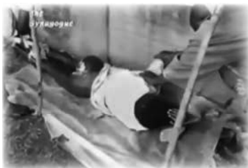
Hombre sufriendo de cáncer de nalgas

Yo no soy el sanador. Solamente conozco al Sanador; ¡Su nombre es Jesucristo!