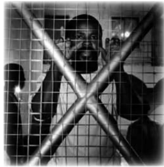
Falso arresto en 1996

Los rumores y las habladurías se extendieron a raíz de este incidente: un profeta detenido en una celda, acusado de traficar con drogas y de albergar armas. Sin embargo, sus enemigos se dieron cuenta de que ni siquiera la detención en una celda