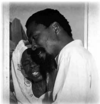
T.B. Joshua con una foto de su madre

Años más tarde, durante una visita a las Bahamas, donde fue recibido por el Gobernador General del país, fue informado de la última enfermedad de su madre. Posteriormente, ella falleció antes de que él pudiera regresar a Nigeria. 5