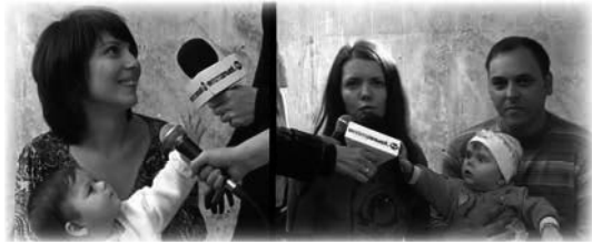
Testimonios del «Fruto del Vientre» en Ucrania

Otra pareja también recibió el milagro a través de la ministración del Agua de Unción, pero de una manera diferente. El pastor de la iglesia había regresado de una visita a La SCOAN a principios