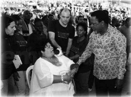
Encuentro en Nazaret con T.B. Joshua, 2019

instalaciones en desuso en una visita anterior, el Espíritu Santo le indicó que ayudara económicamente con una renovación importante para este lugar sagrado, de modo que incluso después del evento, la ciudad de Nazaret se quedaría con un valioso espacio renovado.