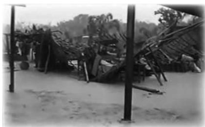
La segunda iglesia, destruida por una tormenta

las inundaciones. Debido a esto y al creciente número de fieles que asistían a la iglesia, el Espíritu Santo instruyó a T.B. Joshua para que se trasladara a una nueva ubicación a unos tres kilómetros de distancia.