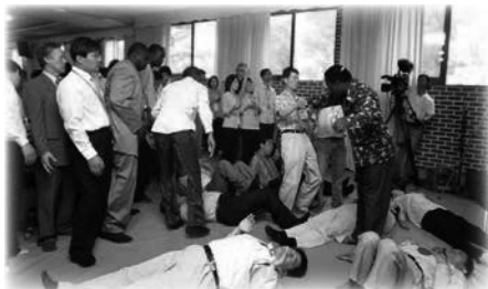
Conferencia de Pastores de 2005 en Corea con T.B. Joshua

El tercer mensaje fue sobre el pecado, Tu Verdadero Enemigo . «Tu enemigo, satanás, no puede gobernarte, controlarte o darte ordenes sin el pecado. Por lo tanto, el pecado es tu enemigo real». El mensaje final fue de aliento, enfatizando de que Dios es bueno todo el tiempo. Enseñando a partir de la vida de Job, animó a la multitud: «Tanto si recibes sanidad como si no, tanto si el Profeta T.B. Joshua los atiende como si no, permanezcan fieles a Jesús, porque la sanidad es para la salvación de su alma».