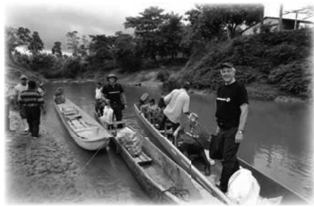
Preparando el regreso a San Salvador en canoa

¿Y ahora qué? Bueno, sabíamos que los Chachi necesitaban una escuela. Cuando el arquitecto presentó el proyecto, éste era mucho más grande y mejor que el edificio anterior. El nuevo plan consistía en una estructura de alta calidad para albergar un jardín de infantes, una escuela primaria y una escuela secundaria con un total de 14 aulas, así como una cocina y un comedor, una sala de profesores, una sala de administración y pequeños laboratorios de informática y ciencias. Estaba claro que el presupuesto sería como mínimo el doble de las cifras aproximadas que habíamos calculado inicialmente con el equipo de Lagos, que inclusive eran superiores al valor del proyecto de distribución de alimentos hasta entonces.