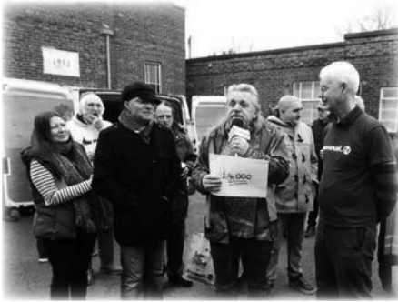
Ayuda para la organización benéfica Flower of Justice