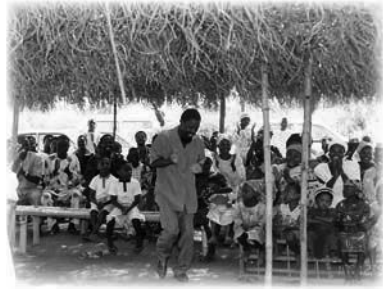
La primera iglesia en 1989

Todos los ancianos aquí han estado escuchando desde una edad temprana que Jesús viene. Hemos estado esperando Su venida hasta ahora, y todavía nos estamos preparando para ello. La razón por la que Jesús no ha venido es porque quiere que tú y yo nos arrepintamos de nuestros pecados porque no quiere