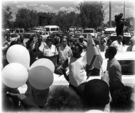
Llegada de T.B. Joshua a Botsuana

sin aire acondicionado, con un simple ventilador, fue una buena práctica de preparación hacia nuestros futuros viajes de Emmanuel TV a Pakistán. Allí, el suministro de electricidad se conectaba y desconectaba por una hora, y definitivamente no había aire acondicionado. Conseguimos banderas nacionales en una tienda de aficionados al deporte para satisfacer pedidos de último momento del equipo local. Estábamos con muchas otras personas preparando el evento para el