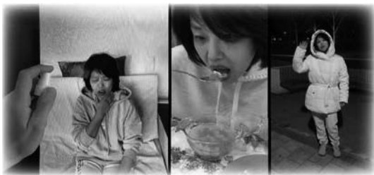
Testimonio de sanidad desde Crimea

Animados al ver a T.B. Joshua sosteniendo el Agua de Unción en la Montaña de Oración y los testimonios en video que llegaban de diferentes países, algunos socios de Emmanuel TV pusieron su fe en marcha. Por ejemplo el caso en que rociaron el agua en la pantalla del teléfono durante una conversación con una mujer de otro país de habla rusa, ella estaba perdiendo peso y energía rápidamente debido a graves reacciones alérgicas que experimentaba cada vez que ingería alimentos normales. La sesión de oración fue grabada, por lo que la reacción quedó a la vista de todos. Al manifestarse y caer al suelo, las ganas de «vomitar algo» eran irresistibles.