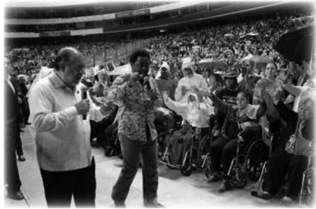
Oración bajo la lluvia en la primera noche