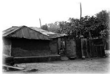
Casa de la infancia de T.B. Joshua

tranquilo en el vientre materno. Durante los últimos tres meses antes del parto, en los que el bebé se vuelve más activo y patea con mayor vigor, el futuro Joshua no manifestaba movimiento alguno. Esto provocó una larga estadía en el hospital para su mamá y aun se hablaba con frecuencia de la posibilidad de practicarle una operación de cesárea (es un procedimiento caro y arriesgado en las zonas más rurales de Nigeria inclusive hasta el día de hoy).