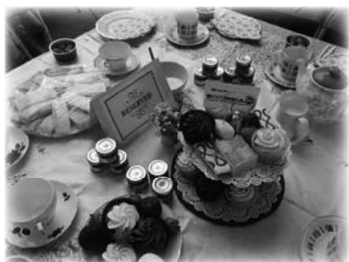
Emmanuel TV patrocina un tradicional Cream Tea inglés para los ancianos

Siempre hubo muchos proyectos de suministro de alimentos locales,