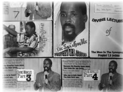
Primeros videos VHS de La SCOAN

A menudo se grababa antes, durante y después de la oración. Los visitantes recibían copias de los testimonios en