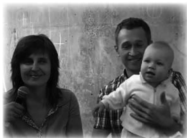
Otro testimonio de Ucrania