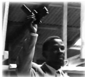
T.B. Joshua muestra el arma recuperada de los ladrones

Era la mitad del servicio de la iglesia, y afuera, sonidos de disparos llenaron el aire. Había ladrones armados en la calle, amenazando con causar estragos con una pistola cargada. En las calles abarrotadas de gente, podían causar una carnicería rápidamente.