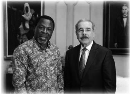
T.B. Joshua con el Presidente Medina de la República Dominicana

Fue un acontecimiento muy colorido, los bailarines glorificaban a Jesús, el cálido viento caribeño acariciaba nuestras mejillas. Cuando el sol se puso y el calor se evaporó, comenzó el verdadero objetivo del día.