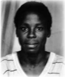
T.B. Joshua después de terminar la escuela primaria

Se recuerda un incidente particular de aquellos primeros días. Sucedió cuando un loco llegó a la escuela con un sable. Los alumnos y los profesores corrían de un lado a otro y nadie quería aproximarse a él. Sin embargo, el «Pequeño Pastor» se acercó con confianza al loco y le ordenó que entregara el sable en el nombre de Jesús, el cual obedeció.