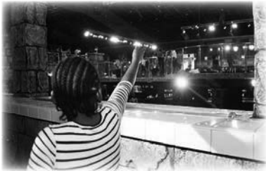
Niña experimenta una visión celestial en el altar de La SCOAN

En uno de los servicios de «Agua Viva», celebrado el lunes 3 de febrero de 2020, una niña de 12 años vio una visión celestial mientras se echaba agua en los ojos en el altar de La SCOAN: