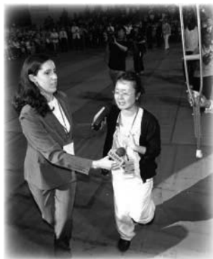
Jovencita recibe sanidad en Corea, 2005

Se había corrido la voz de que se encontraba en la ciudad un hombre con un ministerio ungido de sanidad, y un gran número de personas se agolparon en el complejo deportivo en busca de un milagro. Necesitaban escuchar el mensaje. La cruzada se organizó a lo largo de cuatro días y, guiado por el Espíritu Santo, el Profeta T.B. Joshua predicó mensajes que abordaban algunas cuestiones críticas para recibir la sanidad divina.