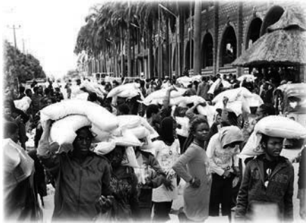
Los nigerianos deportados de Libia reciben apoyo en La SCOAN en 2017

T.B. Joshua no oculta su amor por su país. En el marco de los numerosos proyectos locales de caridad y los programas de becas, a menudo ayudaba a quienes habían intentado alcanzar una ‘mejor vida’ en Europa, tras haber sido engañados por traficantes y personas sin escrúpulos. Esa ‘mejor vida’ a menudo los llevaba a estar encerrados en prisiones de Libia o trabajando como ‘esclavos modernos’. Se pedía ayuda a T.B. Joshua, y el gobierno nigeriano participaba en la repatriación.