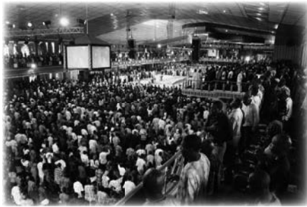
Servicio dominical abarrotado en La SCOAN

En otra ocasión, una anciana sudafricana blanca y refinada admitió que temía ser asaltada. T.B. Joshua le quitó el bolso y se lo devolvió, luego invitó a otros de su grupo sudafricano que intentaran arrebatárselo. Ella levantaba el bolso cuando se acercaban incluso de dos