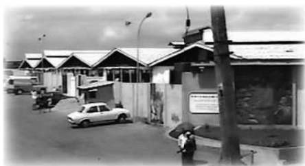
La cuarta iglesia en 1994

Así, en 1994, la iglesia se trasladó a Ikotun-Egbe, su ubicación actual. Este fue el cuarto edificio de La Sinagoga, Iglesia de Todas las Naciones, el primer edificio de la iglesia en el nuevo emplazamiento. Fue este edificio, ampliado, al que llegamos cuando visitamos la iglesia por primera vez en 2001.