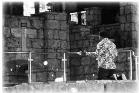
Profeta T.B. Joshua ora en el altar de La SCOAN en 2019

Otro lugar santo en La SCOAN es el área del altar en el auditorio de la iglesia. En los tiempos más tempranos, los miembros de la iglesia se apresuraban a orar allí tan pronto como se cerraba el servicio. Era la época del altar redondo.