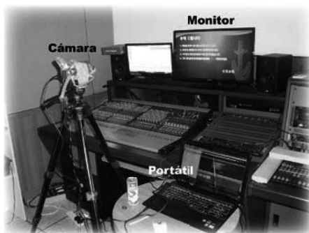
Solución exitosa de «Heath Robinson» para un problema de transmisión en vivo

Necesitábamos una solución inmediata. La transmisión se realizaba a través de una empresa externa que no respondía. Conseguí conectar mi portátil a la red pública de Internet y configurar un nuevo flujo para conectar directamente con el centro de transmisión de Emmanuel TV, pero los cables y convertidores necesarios para llevar el video en directo al portátil no estaban disponibles. Entonces recordé que podía conectar mi cámara de video doméstica al portátil, así que la atamos a un trípode con cinta adhesiva y la apuntamos al «monitor de programa» de la sala de control.