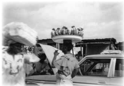
Escena local de Lagos en 2001

sin asfaltar y, a veces, como para hacer el viaje más emocionante, el conductor sin demasiada preocupación cruzaba al lado equivocado de la carretera en plena cara al tráfico.