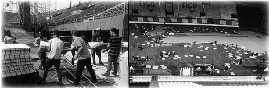
Instalación de la cubierta temporal del terreno de juego para la Cruzada en Paraguay

necesario para cubrir el campo de fútbol para este tipo de eventos. Al fin se consiguió el suelo en un país vecino, pero llegó con retraso debido a problemas aduaneros y logísticos.