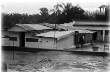
La tercera iglesia en 1992

El tercer edificio de la iglesia también sufrió graves daños por