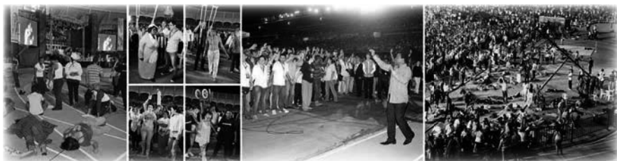
Oración Masiva en Cali, Colombia

Dios actuar de nuevo con tanta fuerza en la sanidad y en los milagros. Una de las muchas sanidades notables de la cruzada tuvo lugar después de la oración masiva, mientras la multitud cantaba: «Hay poder en el nombre de Jesús». Mientras el poder de Dios recorría el estadio, los pies