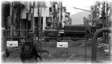
Visita a Portoviejo, Ecuador tras el terremoto de 2016

números de teléfono como posibles contactos. Un miembro del equipo de Emmanuel TV, una de las evangelistas en formación, se unió a nosotros desde Colombia después de 24 horas. Nuestra primera aventura fue un viaje nocturno en autobús local hasta