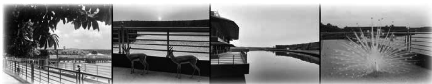
Montaña de Oración a principios de 2021

El «Resort Campo de la Fe», o «Montaña de Oración», fue un proyecto que tardó muchos años en desarrollarse. El «monte» pantanoso fue drenado con gran esfuerzo por los trabajadores, que a menudo trabajaban en simples botes a mano para eliminar los juncos. Con el tiempo se creó una extensión de agua. Con sus pequeñas islas, este lago se convirtió en un refugio para las aves, y la puesta de sol vería el aire lleno de ellas. También se podían observar pequeños monos, pavos reales y antílopes, así como gallos ornamentales.