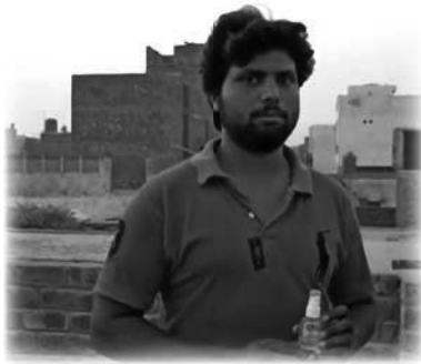
Testimonio de sanidad en Pakistán