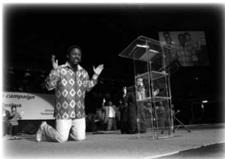
Tiempo de adoración durante la campaña nacional de sanidad con T.B. Joshua

En la segunda noche en el estadio cubierto, T.B. Joshua no acudió al servicio cuando los pastores organizadores lo esperaban. Parecían preocupados y empezaron a llenar el tiempo subiendo al escenario a diferentes pastores locales para que hablaran de su trabajo. Nos mirábamos entre nosotros, mirábamos nuestros relojes muchas veces y nos preguntábamos qué estaba sucediendo. ¿Estaba esta tardanza relacionada de algún modo con la conocida tendencia cultural de la «hora africana»? Pero