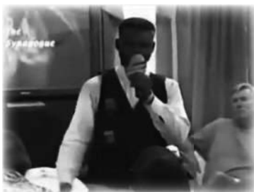
Testimonio tras su sanidad milagrosa

Bajo la influencia del Espíritu Santo, después de la oración, la herida sanó milagrosamente. El hombre dio su testimonio ante una sala de curiosos occidentales, y la historia se incluyó en una compilación de «Milagros Divinos 5» en cinta VHS. Los entusiastas visitantes de la iglesia se llevaron a casa copias para compartirlas.