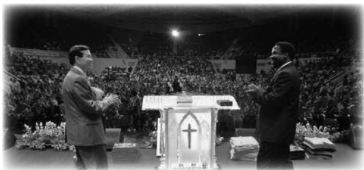
Cruzada Corea por Cristo en 2005

En el primer mensaje, Tu papel parte 1 , dejó claro que recibir la sanidad o la redención no depende solamente de Dios; nosotros también tenemos un papel que desempeñar,