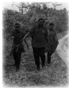
T.B. Joshua continúa hacia la escuela a pie

llegar a la escuela. Hubo dos ceremonias de apertura: una en Quito para varios dignatarios y otra en la propia escuela. La cuestión de cómo T.B. Joshua debería hacer el viaje a la escuela planteó problemas logísticos. Los militares se ofrecieron a proporcionar un helicóptero, pero eso habría sido demasiado peligroso debido a la frecuente niebla y neblina en las montañas de los Andes, por no mencionar la fuerte lluvia tropical. Finalmente viajó por carretera desde Esmeraldas, inclusive por ese camino tuvo importantes dificultades y tuvo que caminar con el equipo durante un largo tramo por el barro, tornándose este trayecto muy agotador.