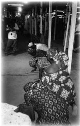
Vomitando sustancias venenosas

A la persona que vomitaba, se la animaba a arrodillarse y a no tumbarse de espaldas por razones de seguridad. Se observaba atentamente y, una vez finalizado el proceso, se ofrecía pañuelos de papel para limpiarse la boca, por último se ayudaba a sentarse de nuevo en su silla, transmitiéndole tranquilidad.