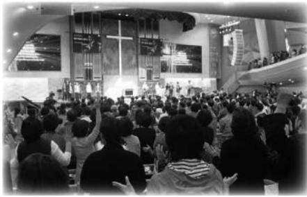
Conferencia de Pastores en Corea del Sur con T.B. Joshua, 2014

La entrada a todos los eventos internacionales había sido gratuita, en la Conferencia de Pastores de Corea del Sur la entrada era libre, pero el equipo descubrió que a los «donantes asociados» que apoyaban a los organizadores hasta cierto nivel, se les ofrecía un asiento en una sección más cercana a la parte