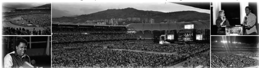
Cruzada de Milagros con T.B. Joshua en el Estadio Olímpico, Cali, Colombia

Casi 20 años antes, los cristianos devotos a la oración habían llenado el mismo estadio, tras el martirio de un destacado pastor de la ciudad, que había provocado un renacimiento de la fe. Pero, como explicaron los pastores locales, los fuegos del avivamiento habían disminuído desde entonces con el tiempo, y el evento era muy esperado. Los creyentes