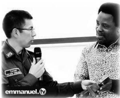
Reunión de la policía con T.B. Joshua en Cali, Colombia

La Policía Metropolitana de Cali también organizó un evento en el que entregó a T.B. Joshua un premio honorífico y su propia gorra de policía. T.B. Joshua realizó una generosa donación de 100.000 dólares al fondo social para los huérfanos, las viudas o los heridos en acto de servicio y compartió un mensaje de agradecimiento por