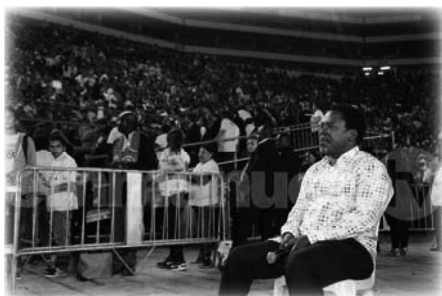
T.B. Joshua espera a que la multitud se calme

Un momento memorable fue cuando el Profeta T.B. Joshua dejó de orar por la gente y se sentó porque había riesgo de que la multitud se lastimara. Dijo que no se movería hasta que la gente volviera a sus asientos, cosa que hicieron debidamente.