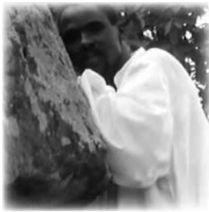
Orando en la montaña

Estuve en trance durante tres días consecutivos, entonces vi una mano que apuntaba una Biblia a mi corazón, y la Biblia