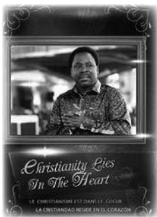
Una nota de sermón reciente

T.B. Joshua explicaba que nuestra relación con Dios podía ser