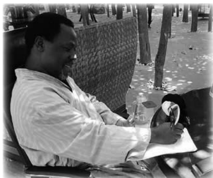
T.B. Joshua estudiando en la Montaña de Oración

El amor por los animales siempre formó parte de la vida de T.B. Joshua, se conectaba con la naturaleza y la creación. Es así que pájaros, antílopes y pavos reales deambulan libremente por la «Montaña de Oración» en Lagos, también conocida como «Campo de Fe».