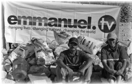
Provisiones de alimentos en la clínica médica de Emmanuel TV en Arcabaie

todos los niños requerían tratamiento por el agua en mal estado. La gente estaba aterrorizada tras el terremoto y dormían a la intemperie. Haití (esa parte) era extremadamente pobre, y el mercado local se asemejaba a los de 300 años atrás, las mercancías llegaban en burros. Un claro mensaje de T.B. Joshua al equipo reunido fue que viviéramos más como los lugareños y, por inferencia, que evitáramos las trampas de alojarnos en cómodos hoteles alejados del modo de vida