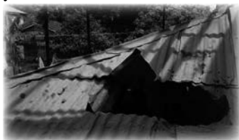
Techo perforado por el gran trozo de roca

—Señora, debe estar muy agradecida a Dios por haber dado a luz sana y salva— exclamaron las mujeres— ¿qué tendrá reservado Dios Todopoderoso para su hijito?