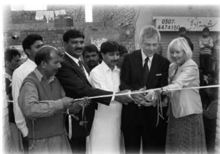
Inauguración de la Escuela Emmanuel en Pakistán el 9 de marzo de 2012