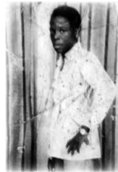
T.B. Joshua a los 17 años

Llevar la Biblia abiertamente estaba prohibido, y