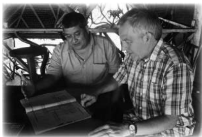
Gary y el arquitecto hablan de los planes de la nueva escuela

era una labor substancial de hacer incluso si se trataba de una visita de una hora a San Salvador. El arquitecto finalizó el plan integral de la escuela y lo presentamos al Departamento de Educación del Gobierno justo a tiempo antes de que se cerrara el plazo de dos meses para auxilios de emergencia. El Gobierno solo autorizaba la ayuda externa para un proyecto de este tipo en estado de emergencia. El plan fue aprobado, pero luego hubo retrasos burocráticos a nivel local que podrían haber amenazado todo el proyecto. Sin embargo, una vez más, experimentamos la provisión de Dios. Un «encuentro casual» con el entonces vicepresidente de la nación (Jorge Glas) ayudó a despejar el camino, y el proyecto siguió adelante para gran beneficio de la comunidad indígena Chachi y para los 300 alumnos de la escuela.