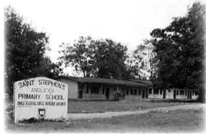
Escuela Primaria Saint Stephen, Arigidi

Allí se ganó el apodo de «Pequeño Pastor» y dirigía la Hermandad Cristiana de Estudiantes.