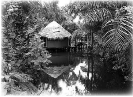
Cabaña en la Montaña de Oración en 2004

negocios, sino de un momento de enseñanza personal.