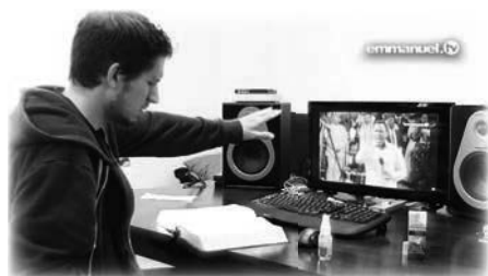
Participación a distancia en la Oración Masiva

Conocí a un evangelista de La SCOAN. Me dio un frasco del Nuevo Agua de la Mañana del