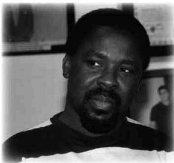
T.B. Joshua en 2003

¿Quién es este Jesús en cuyo poderoso nombre se ofreció la oración con el resultado de ver sanados a los afligidos y liberados a los oprimidos? Es el Hijo de Dios, el mismo que derramó Su sangre en la cruz por nuestros pecados y por cuyas heridas fuimos sanados.