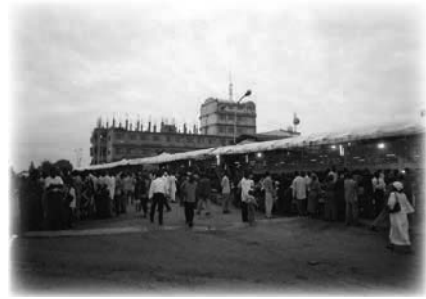
Multitud fuera de La SCOAN en 2001

Con un nivel de «avivamiento» de conciencia de pecado que volvía a arder en mi corazón, esperé a entrar al pequeño despacho de T.B. Joshua para mi breve cita con él. Lo vi con mis ojos, pero no lo «vi». La conciencia de Dios era algo que, una vez experimentada, nunca se olvida. Me recordó el