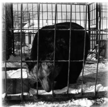
El oso ruso enfadado

De repente veo que Gary se tambalea, e instintivamente lo alejo (justo a tiempo). La jaula no estaba en buen estado, y el oso clavó sus dientes en el brazo de Gary a través de su abrigo (un ataque maligno