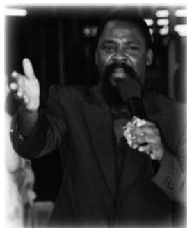
T.B. Joshua predicando en 2002

«¿Cómo te comportas en casa, en el mercado?». Con un semblante cálido pero serio, el hombre de Dios se dirigía a la congregación. En el sermón sobre la semejanza con Cristo en una de nuestras primeras visitas nos habló directamente a todos los que estábamos escuchando. El cristianismo no es una religión, sino una relación con Jesucristo que debe influir en nuestra forma de vivir.